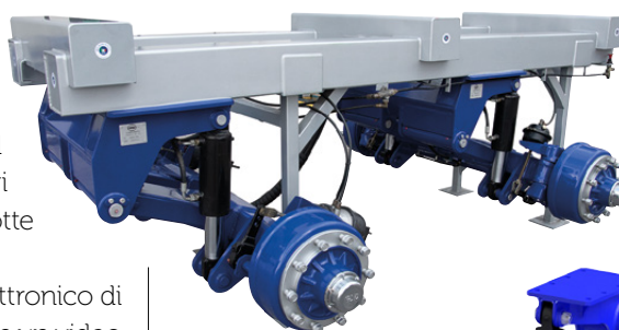
Sistema elettronico di sterzata