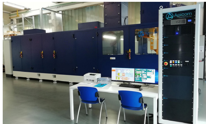
Il nuovo banco prova di Fad Assali